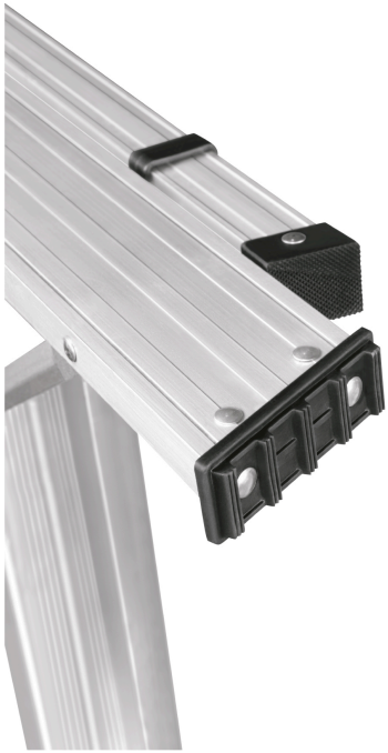
Tacones plásticos antiderrapantes