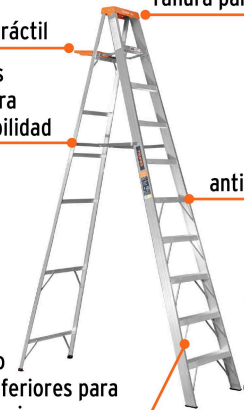
Doble refuerzo en peldaños inferiores para mayor resistencia