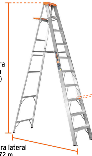
Apertura lateral 1.72 m