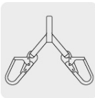
Doble brazo en "Y"