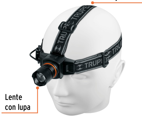
Banda elástica ajustable