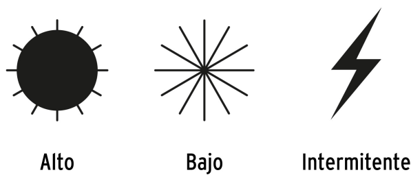
Modos de iluminación