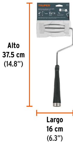
Peso: 0.14 kg (0.3 lb)