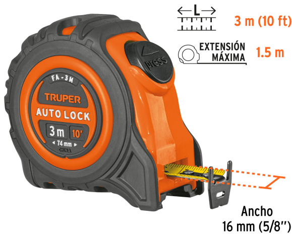
Cinta impresa por ambos lados