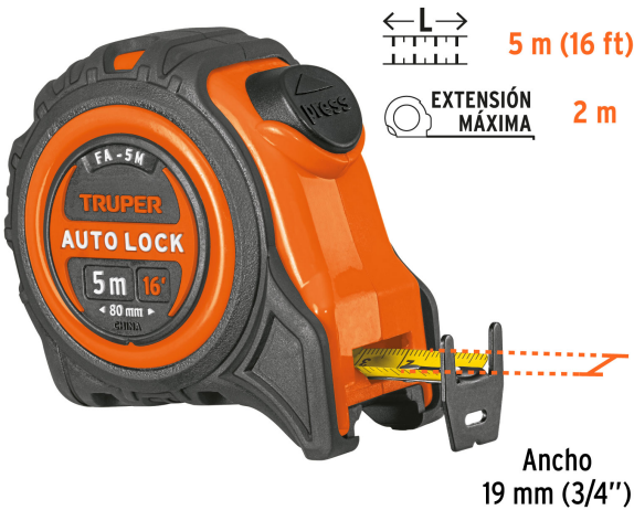
Cinta impresa por ambos lados