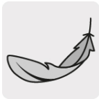
Ligera de fácil manejo