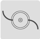
Carrete de hilo