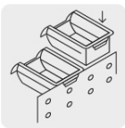
Pestaña posterior para rieles o rejillas