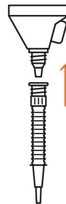
Dos piezas extensión con rosca