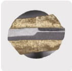
Punta de carburo de tungsteno