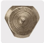
Zanco P3 antiderrapante