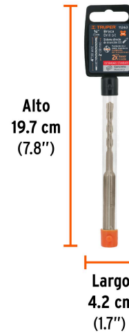
Peso: 0.04 kg (0.09 lb)