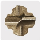
Punta de cruz