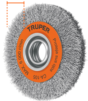
Diámetro 6" (150 mm)