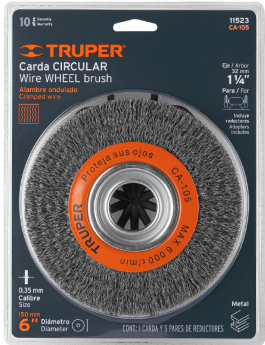
Largo 18.2 cm (7")