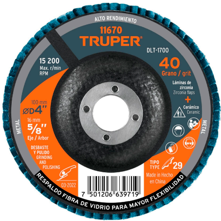
Diámetro interior 5/8"