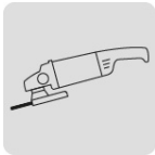
Para esmeriladora angular