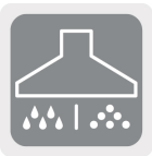
Mojado y seco