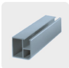
Metales no ferrosos