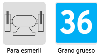
Para esmeril Grano grueso