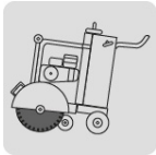
Cortadora de piso