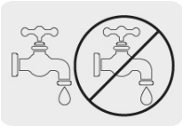
Corte en seco o húmedo