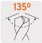
Punta Split Point