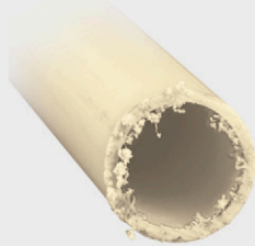
Corte con segueta