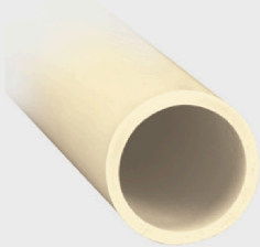
Corte con cortador de tubo

Para cortes en tubo de pared delgada, gire el tubo para facilitar el trabajo