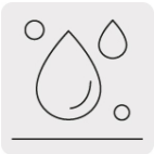
Resistente a la humedad