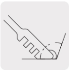
Ángulo de corte de 90º