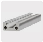
Metales no ferrosos