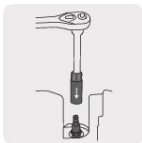
Inserto de neopreno