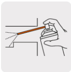
Aplicador para lugares de difícil acceso