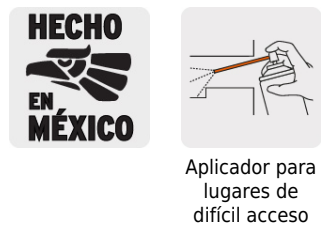
Aplicador para lugares de difícil acceso