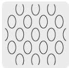
Malla al reverso