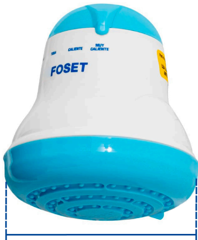
Diámetro 14.5 cm