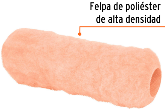
Felpa de poliéster de alta densidad

Fabricado en México bajo las estrictas especificaciones de GRUPO TRUPER