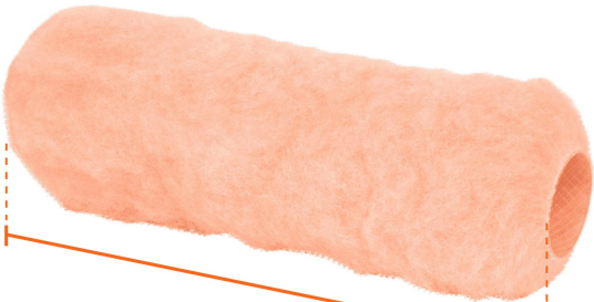
Largo 9" (23 cm)