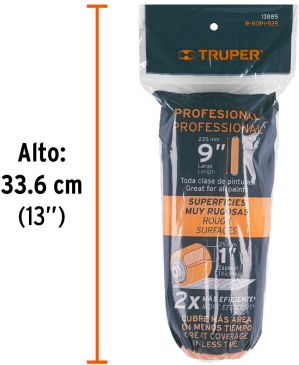
Alto: 33.6 cm (13")