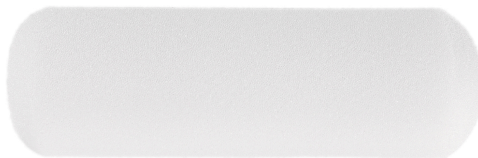
Largo 4" (10 cm)