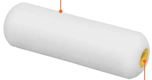
Tubo de polipropileno