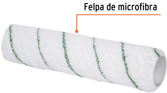
Felpa de microfibra

Fabricado en China bajo las estrictas especificaciones de GRUPO TRUPER