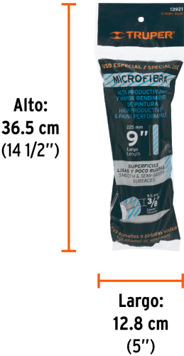
Alto: 36.5 cm (14 1/2")