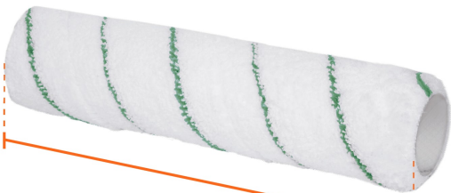
Largo 9" (23 cm)