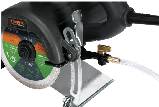
Sistema de lubricación de corte