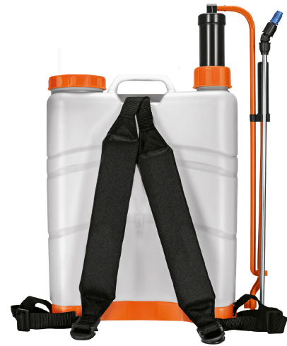
Correas ajustables y acojinadas para mayor comodidad