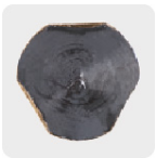
Zanco P3 antiderrapante