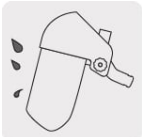
Protección contra impactos