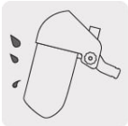
Protección contra impactos