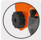
Perilla para ajuste