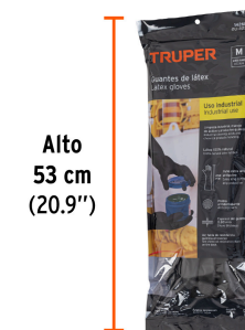
Alto 53 cm (20.9")