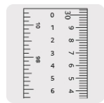
Graduación vertical al reverso para fácil lectura