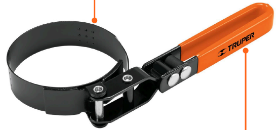
Mango articulado cubierto de vinil