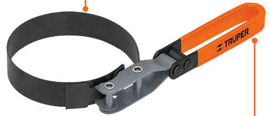
Mango articulado cubierto de vinil