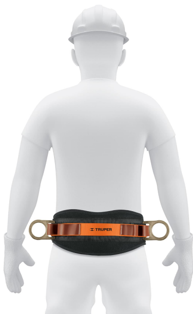
Cinta de poliéster ajustables con hebillas de acero forjado