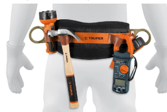
Compartimentos para herramientas