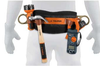
Compartimentos para herramientas