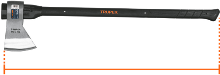
Largo 36" (90 cm)