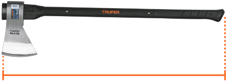
Largo 36" (90 cm)