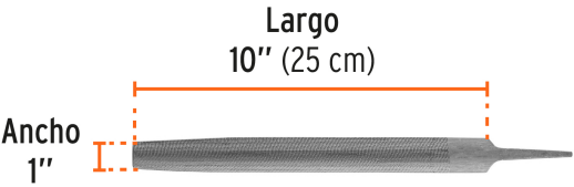
Picado doble para desbaste rápido