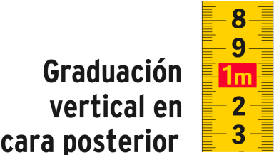
Graduación vertical en cara posterior