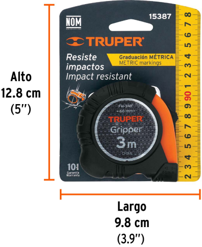
Peso: 0.14 kg (0.3 lb)