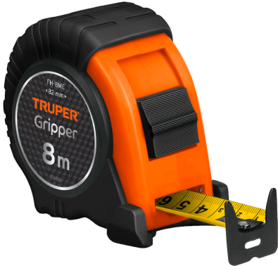
Cinta impresa por ambos lados