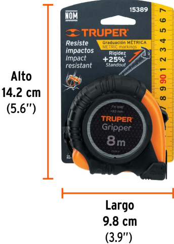
Peso: 0.46 kg (1 lb)